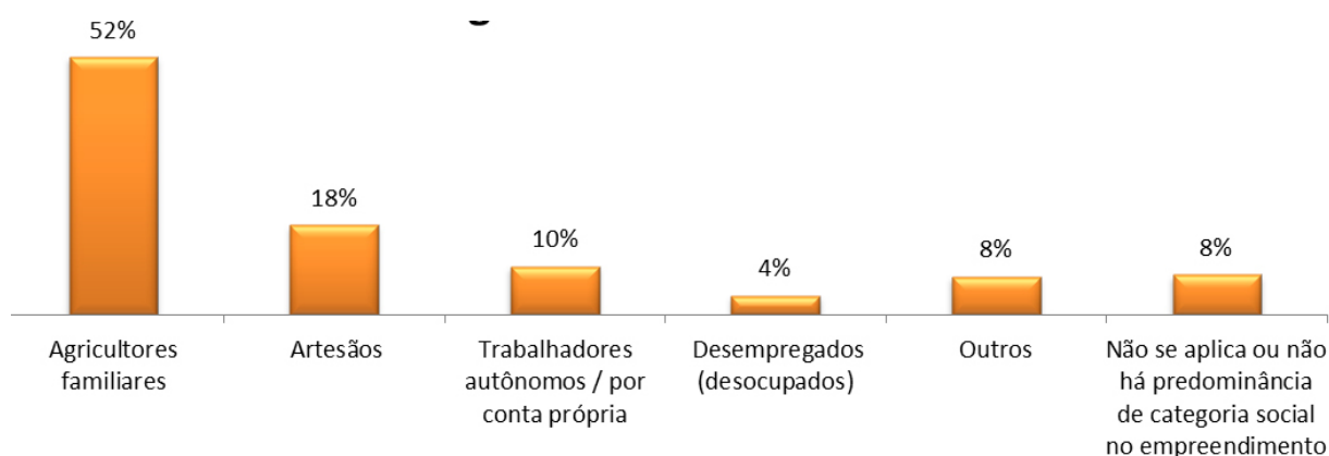
Figura 2 – EES segundo a categoria social dos sócios – Região Norte

Quanto as principais categorias sociais dos associados aos EES na região Norte constata-se que, de forma semelhante à região Sul predominam os EES compostos predominantemente por agricultores familiares (52%), seguindo-se a categoria dos artesãos com 18% dos EES. Os EES formados predominantemente por trabalhadores autônomos compõem 10% dos EES.